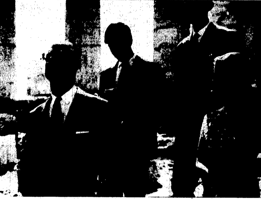
Atene: il duce Filippo di Edimburgo (in primo piano) ed i figli Carlo (alle sue spalle) ed Anne, giunti in Grecia per le nozze di re Costantino, hanno visitato ieri l'Acropoli.