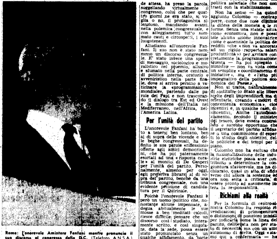
Roma: l'onorevole Amintore Fanfani mentre pronuncia il suo discorso al congresso della D.C.

IL SUO DISCORSO HA AVUTO IL SENSO DI UNA CANDIDATURA PER L'EVENTUALE ELEZIONE ALLA PRESIDENZA DELLA REPUBBLICA