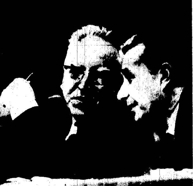
Roma: il presidente del Consiglio onorevole Aldo Moro (a destra) a colloquio con il senatore Silvio Gava durante il congresso della democrazia cristiana.